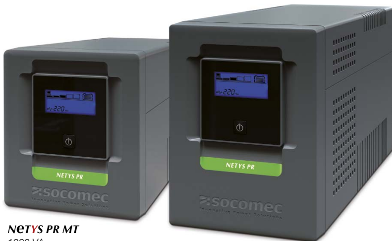
NETYS PR MT 1000 VA