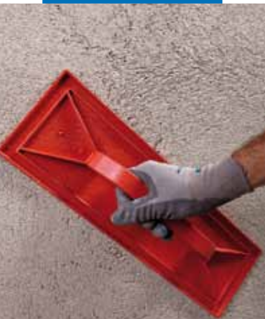
Acabamento do Mape-Antique MC