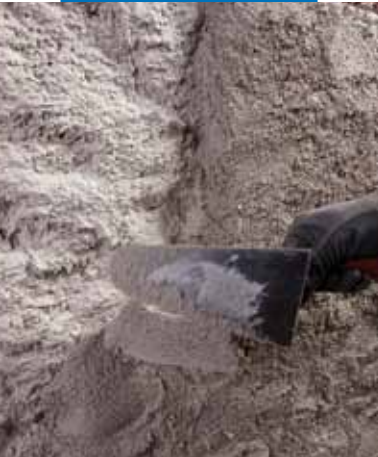
Aplicação do Mape-Antique MC sobre Mape-Antique Rinzafo