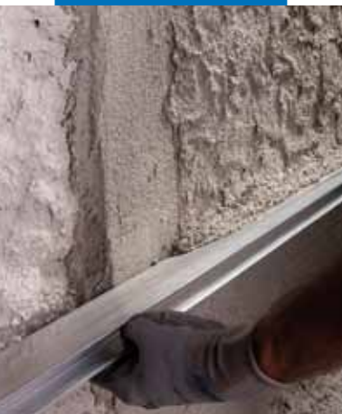
Nivelamento do Mape-Antique MC