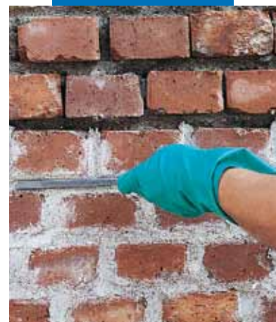
Enchimento das juntas com Mape-Antique MC