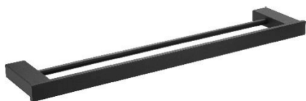
AI1411B Acabamento Preto

TOALHEIRO DUPLO DE PAREDE Série HARMONIA