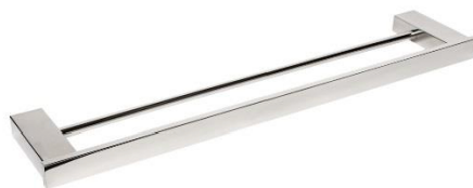
AI1411C Acabamento Brilhante