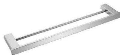
AI1411CS Acabamento Escovado