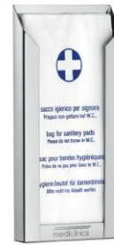
DBH100CS acabado satinado