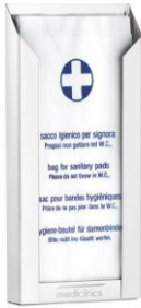
DBH100 acabado epoxi blanco