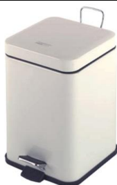
PP1206 / PP1214 Acabado blanco