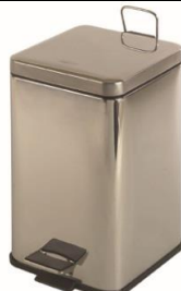
PP1206C / PP1214C Acabado brillante