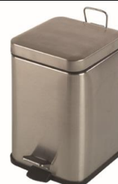
PP1206CS / PP1214CS Acabado satinado