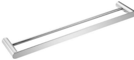
AI1311C Acabado brillante