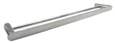
AI1311CS Acabado satinado