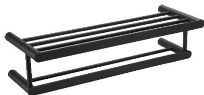
AI1323B Acabamento Preto