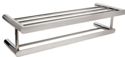
AI1323C Acabamento Brilhante