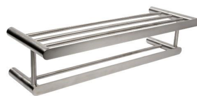
AI1323CS Acabamento Escovado