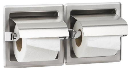
AI0320CS Acabado satinado