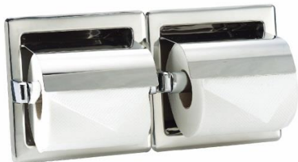
AI0320C Acabado brillante