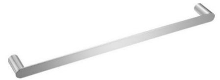
AI1313CS Acabado satinado