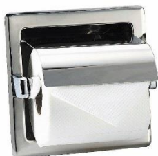
AIE310C Acabado brillante