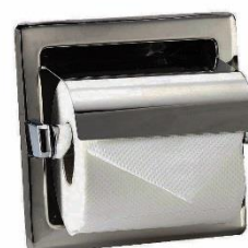
AIE310CS Acabado satinado