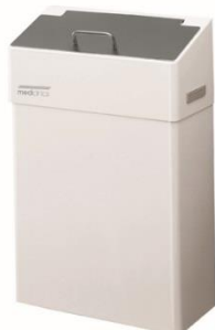
PP0010 / PP0018 Acabado blanco