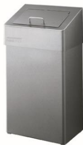
PP0010CS / PP0018CS Acabado satinado