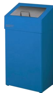
PP0010RAL / PP0018RAL Acabado RAL