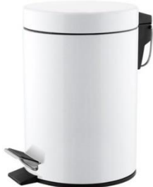
PP1303/PP1305/PP1312/PP1321 Acabado blanco