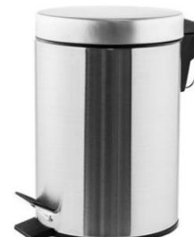
PP1303CS/PP1305CS/PP1312CS/PP1321CS Acabado satinado