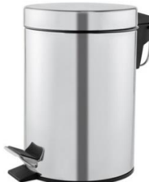
PP1303C/PP1305C/PP1312C/PP1321C Acabado brillante