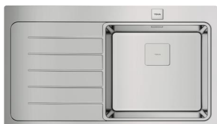
Imagem: Versão com escorredor à esquerda