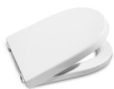
Assento e tampa