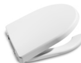
Tampa e aro para sanita