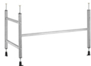
Elemento instalação de painéis para banheira