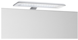
Aplique LED com suporte