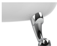
Savanha / Garra de Leão: Conjunto de 4 pés cromados