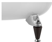
Classic: conjunto de 4 pés de ferro fundido cromado