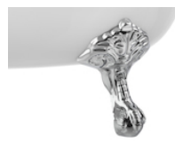
Eagle: conjunto de 4 pés cromados