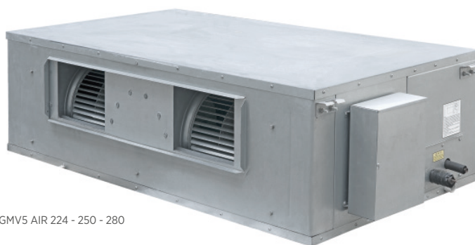
GMV5 AIR 224 - 250 - 280